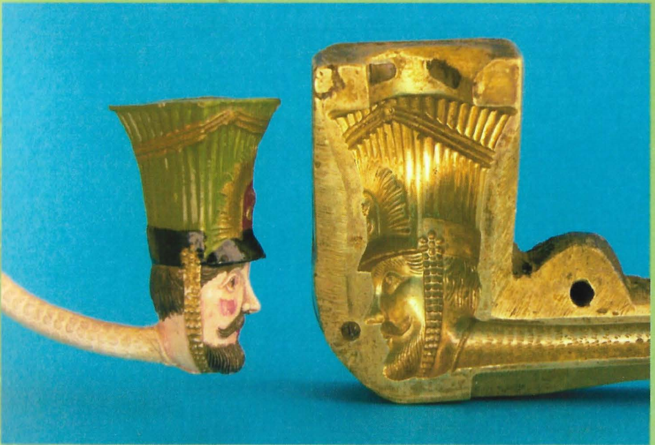
Afb. 3, Huzarenpijp en vorm van Van Duijn