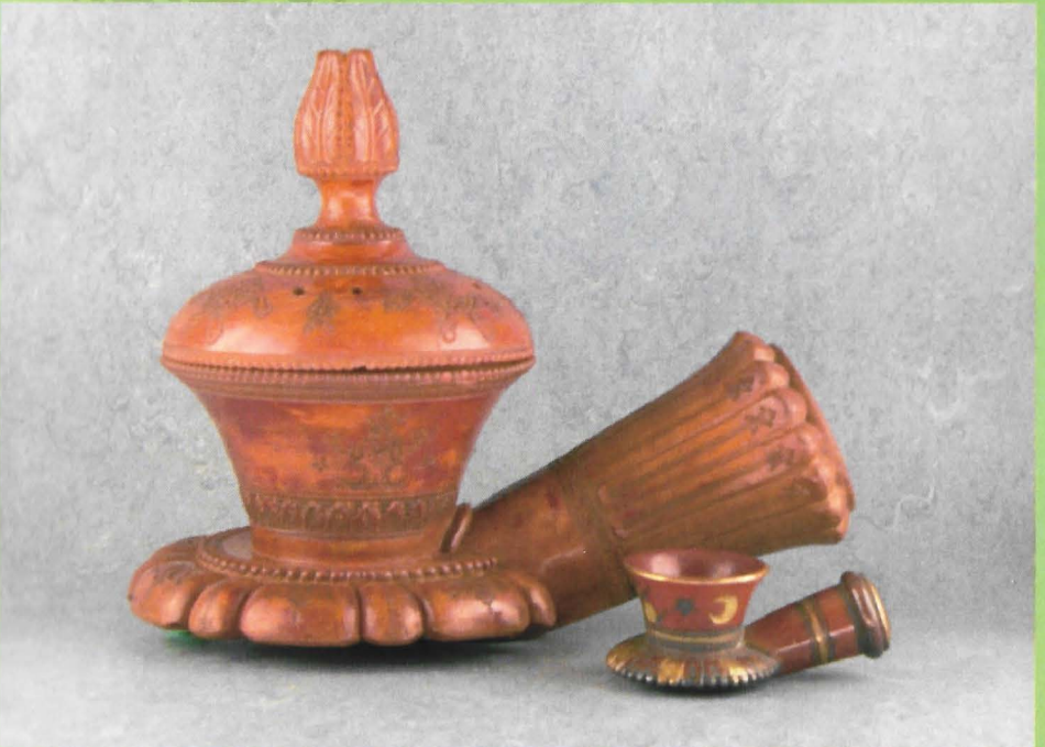
Afb. 4, Turkse reuzenpijp