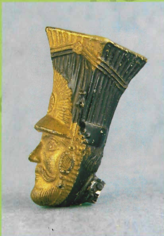
Afb. 2, Huzarenpijp van P.J. van der Want